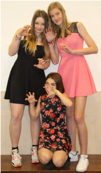
Filmprojekt `Helping Hands`

Übrigens: Darstellen und Gestalten ist kein Theater! Ihr müsst also keine langen Texte auswendig lernen, sondern es geht um kleine Rollen, die oft nicht einmal Text haben.